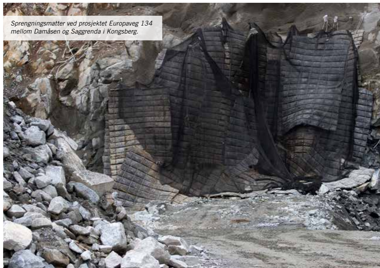
Sprengningsmatter ved prosjektet Europaveg 134 mellom Damåsen og Saggrenda i Kongsberg.

B&G utfører dessuten alt fra pallboring til injiseringsboring og grovhullsborring for kabel og rørgjennomføringer, samt mer komplekse oppdrag som stagboring. Ved stagboring drilles lange stag ned i fjellet i vifteform, og slik kan man stabilisere store elementer på jordoverflaten. Vi tar på oss bore- og sprengoppdrag på kort varsel og sender våre rigger over hele landet.