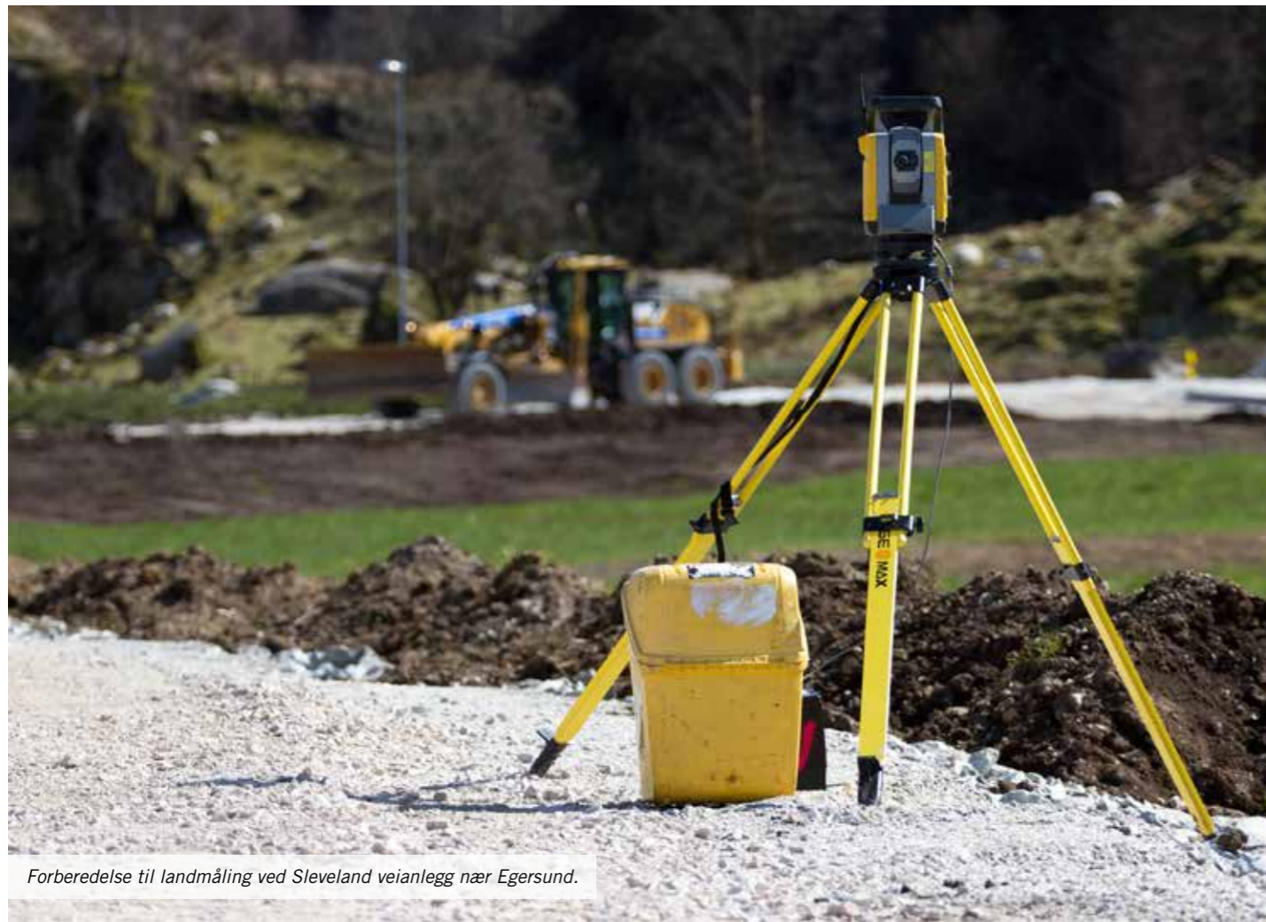
Forberedelse til landmåling ved Sleveland veianlegg nær Egersund.