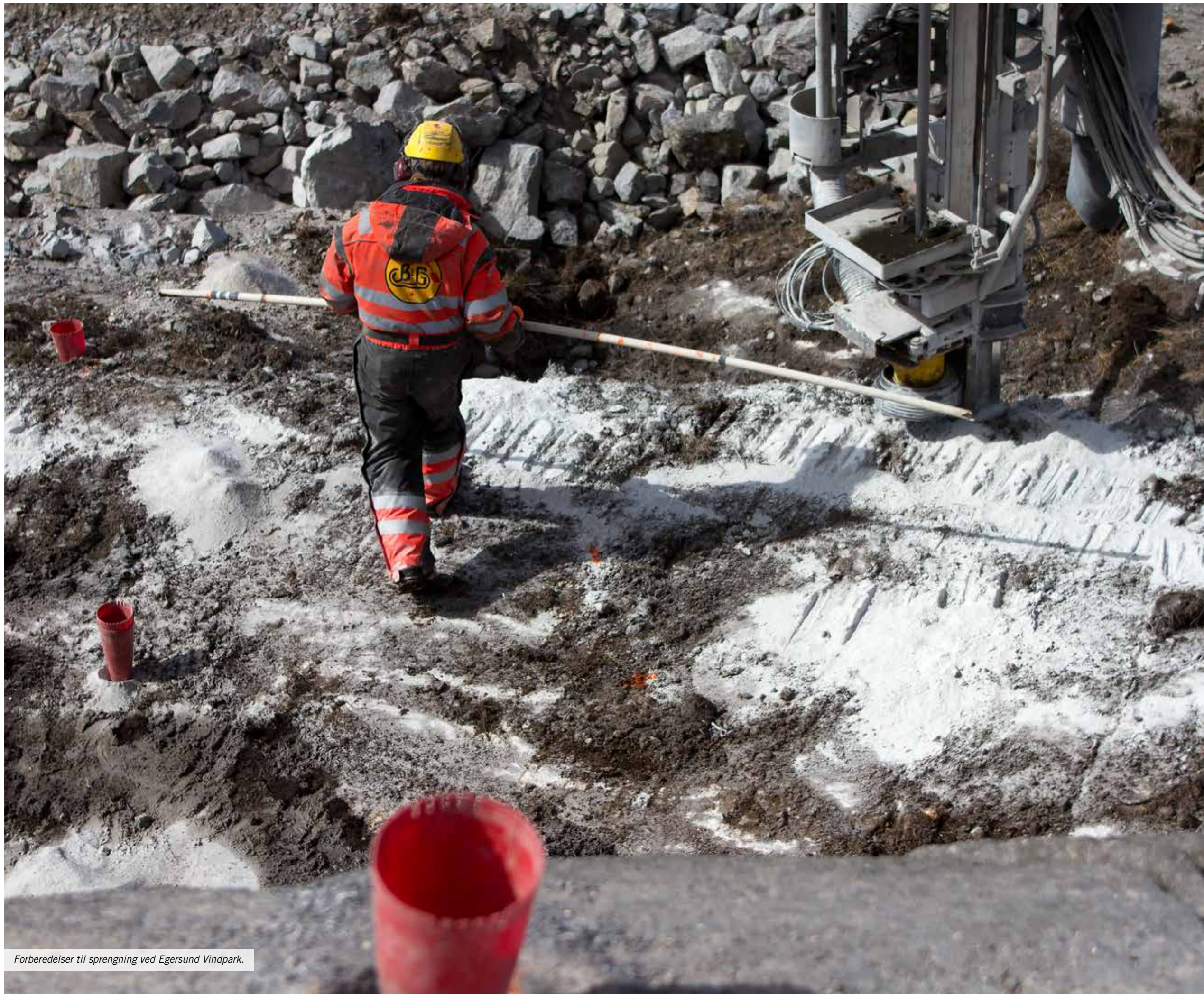
Forberedelser til sprengning ved Egersund Vindpark.