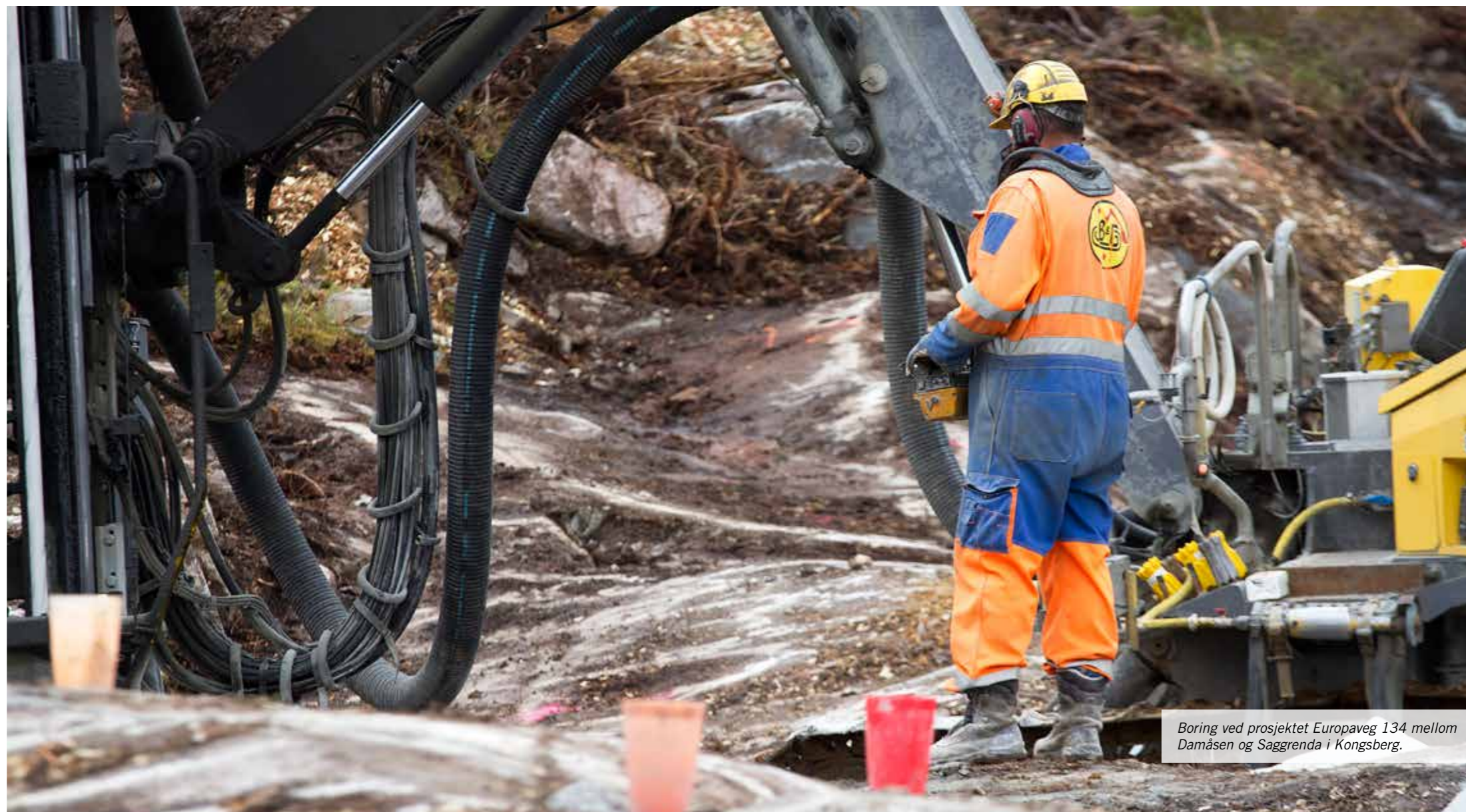
Boring ved prosjektet Europaveg 134 mellom Damåsen og Saggrenda i Kongsberg.