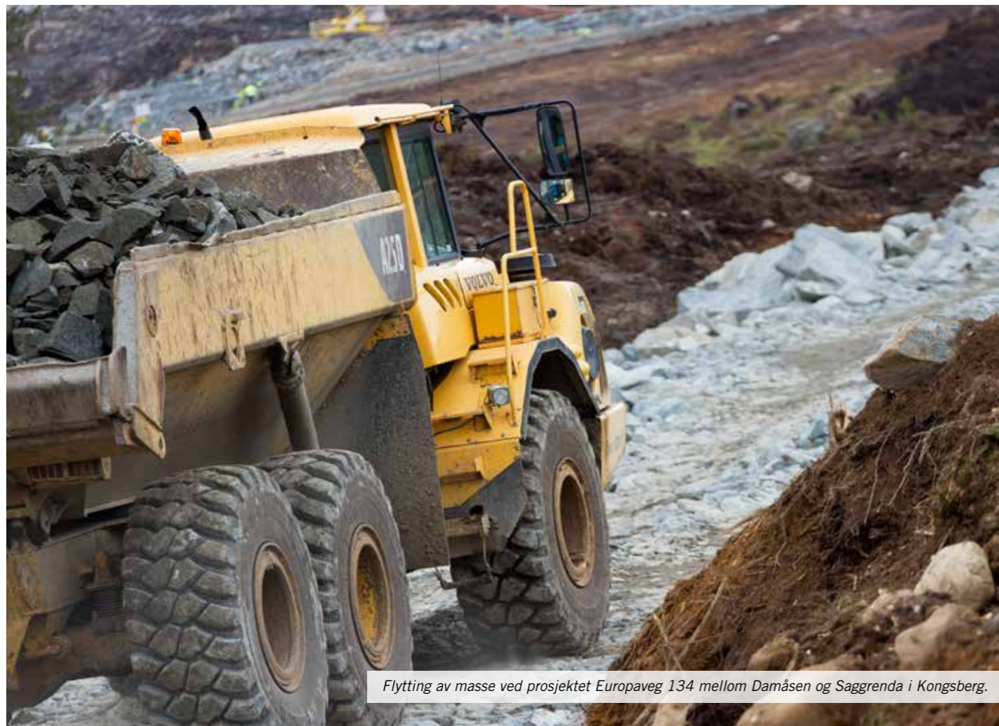
Flytting av masse ved prosjektet Europaveg 134 mellom Damåsen og Saggrenda i Kongsberg.