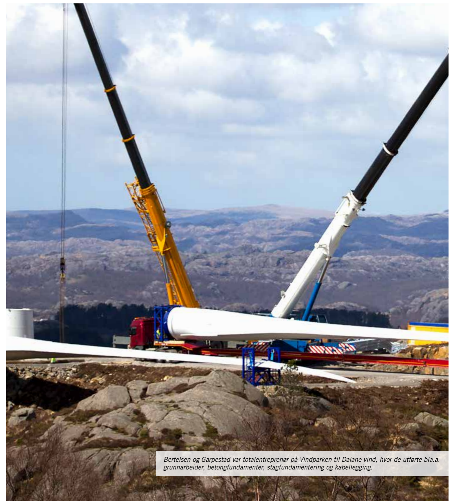
Bertelsen og Garpestad var totalentreprenør på Vindparken til Dalane vind, hvor de utførte bla.a. grunnarbeider, betongfundamenter, stagfundamentering og kabellegging.