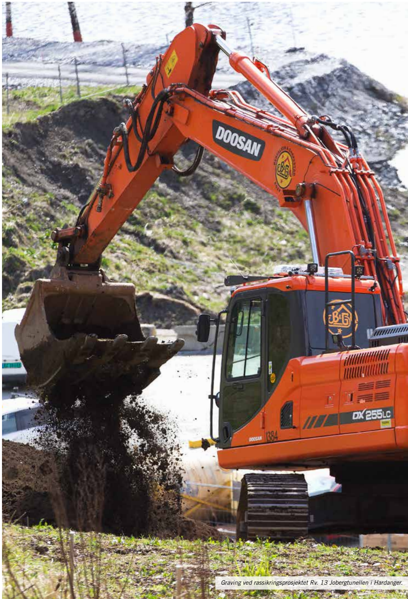
Graving ved rassikringsprosjektet Rv. 13 Jobergtunellen i Hardanger.