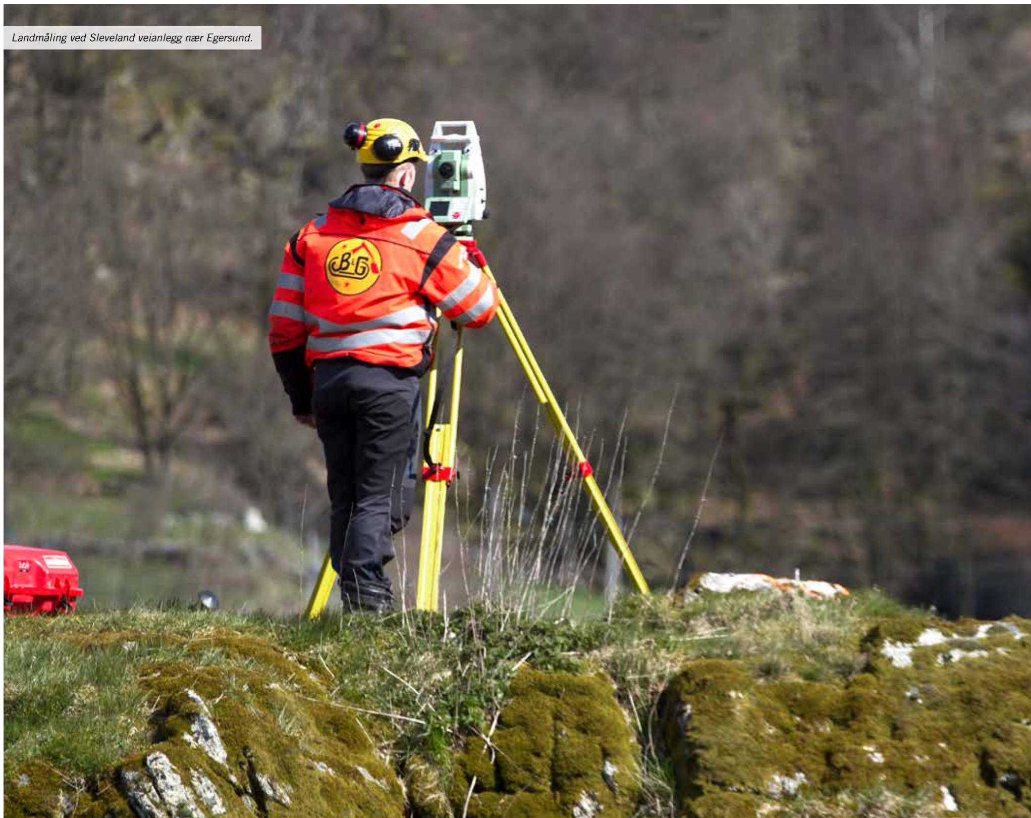
Landmåling ved Sleveland veianlegg nær Egersund.