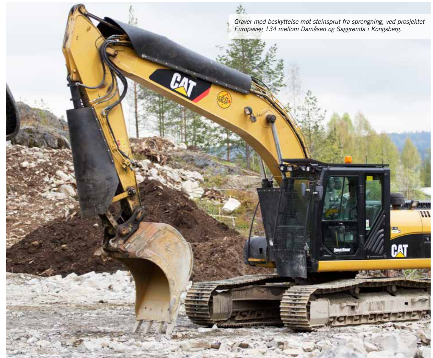
Graver med beskyttelse mot steinsprut fra sprengning, ved prosjektet Europaveg 134 mellom Damåsen og Saggrenda i Kongsberg.