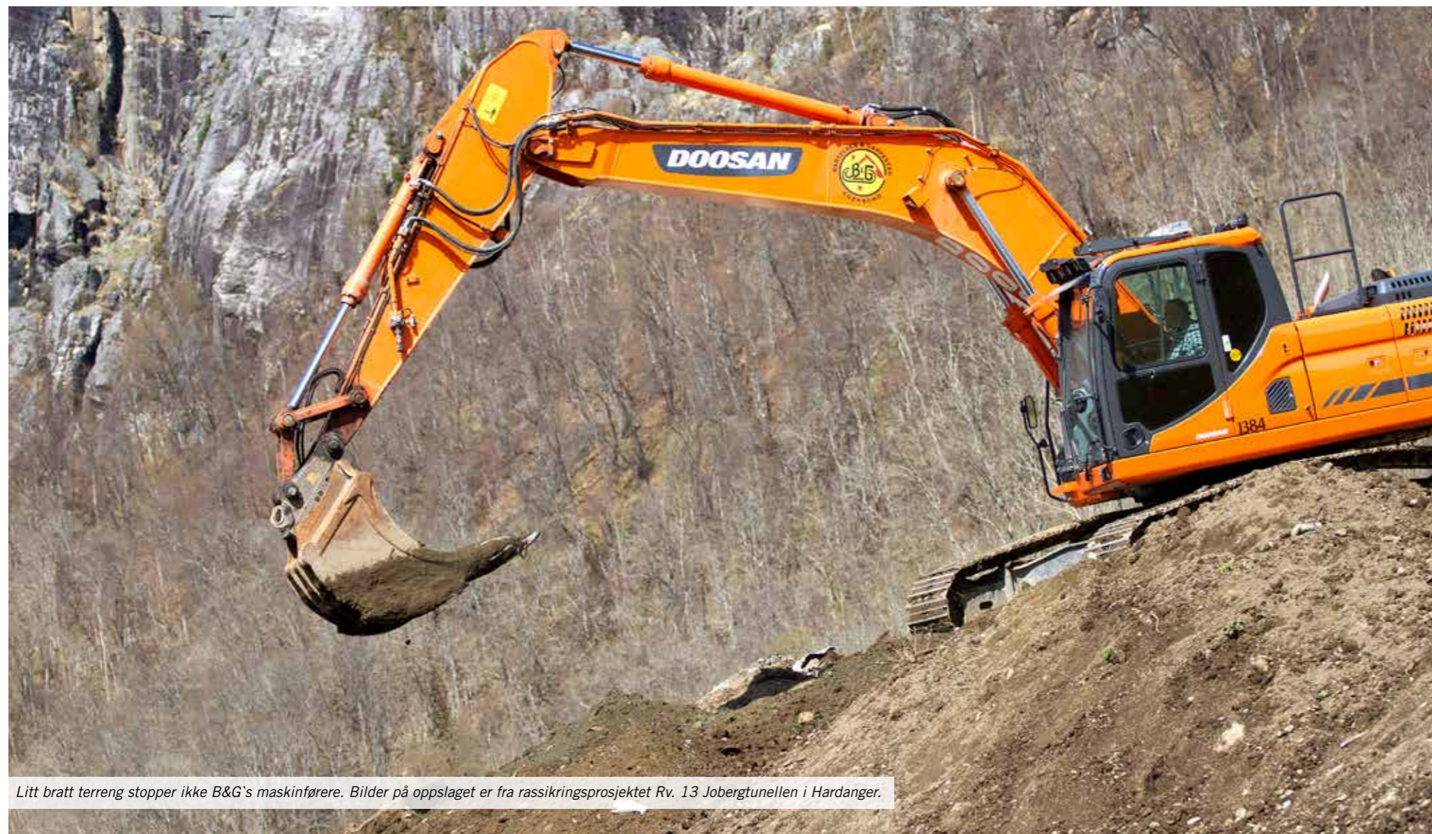
Litt bratt terreng stopper ikke B&G's maskinførere. Bilder på oppslaget er fra rassikringsprosjektet Rv. 13 Jobertunellen i Hardanger.