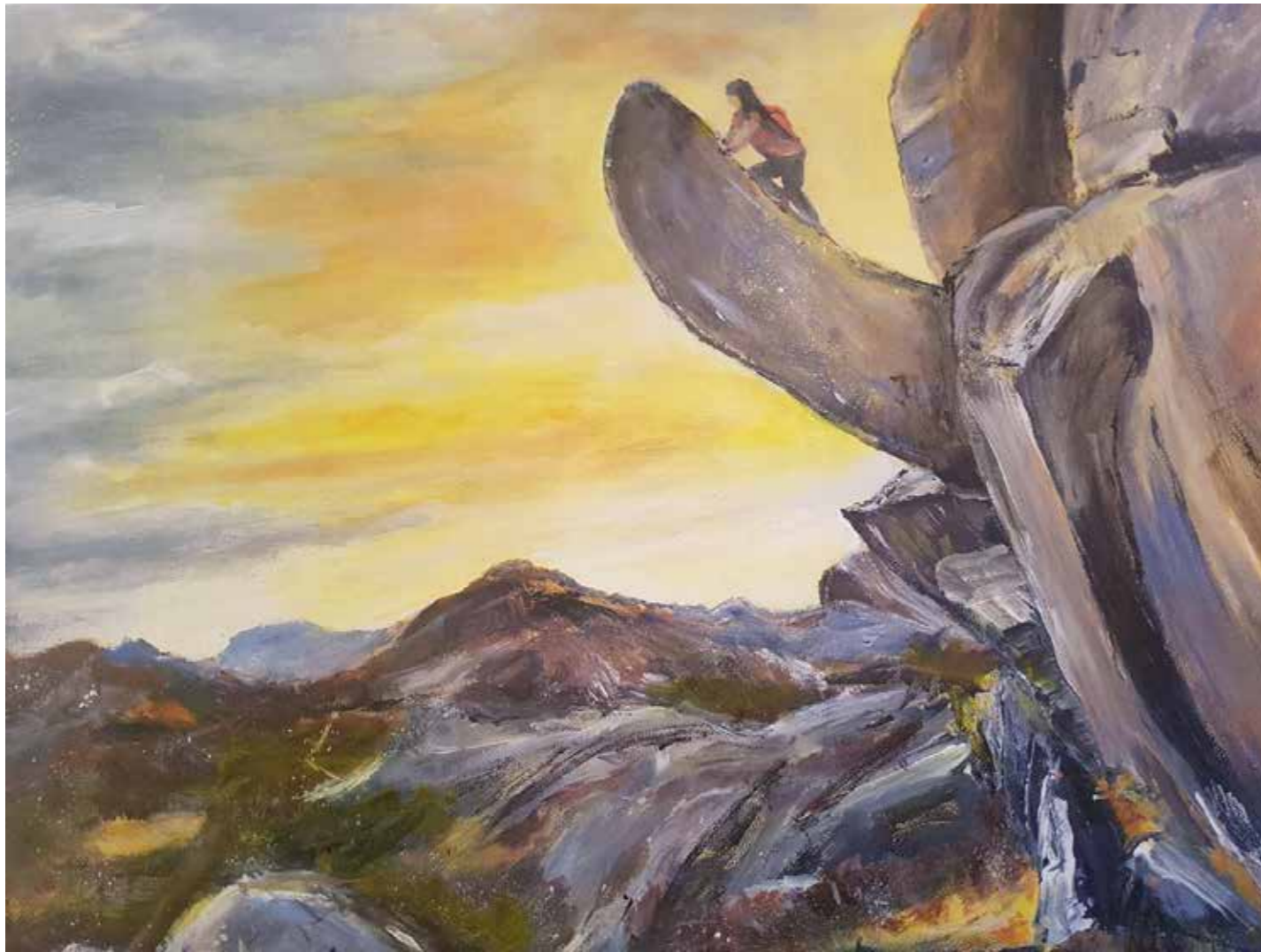
Illustrasjon: Wenche Røyland